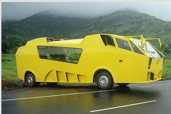
Un Bus deportivo...