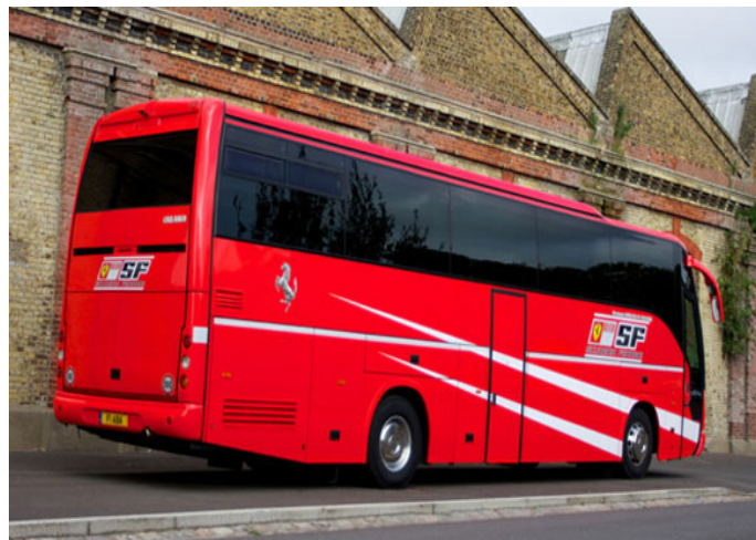
El bus que transportó a Schumacher y Barrichello espera nuevo dueño.