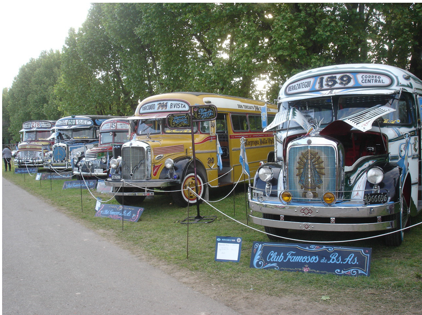
Las 6 unidades restauradas fueron una linda atracción para grandes y chicos que no se fueron sin su boleto.

Queremos destacar la buena organización desplegada. Es un evento histórico al que recomendamos asistir. Esperamos estar presentes en una próxima exposición!.