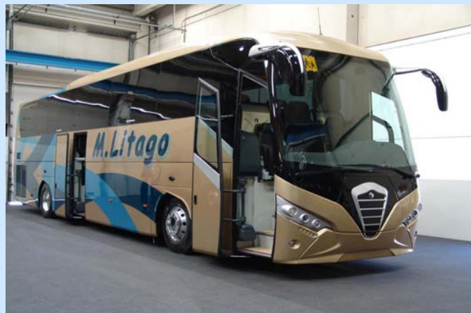
Noge Touring HDH

http://www.facebook.com/ Busmanía (Vinarós)