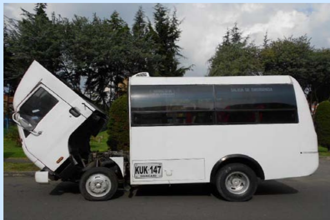
Mini Bus Kía

http://www.facebook.com/ Busmanía (Vinarós)