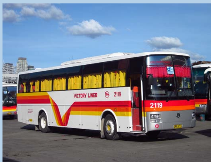
SR Modulo MAN 18.310 - Victory Liner 2119