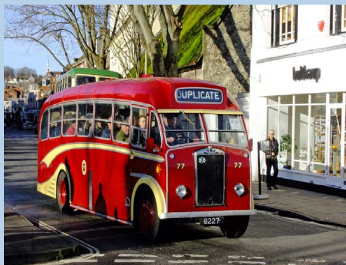
1957 Albion Victor